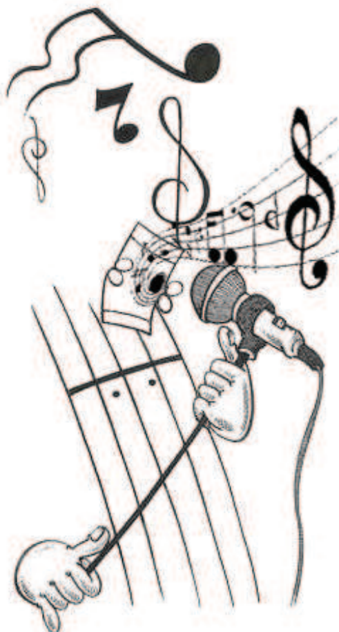
Lluvia de Dios- Blest

Lluvia de Dios refresca mi ser Fluye dentro de mí y límpiame