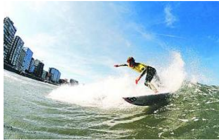
Uno de los participantes en el campeonato.