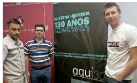
El curso se presentó ayer en el Ayuntamiento.

Al finalizar la instrucción deportiva, los mejores alumnos serán premiados. A continuación, la organización tiene previsto una merienda cena para disfrutar de un tiempo de convivencia.