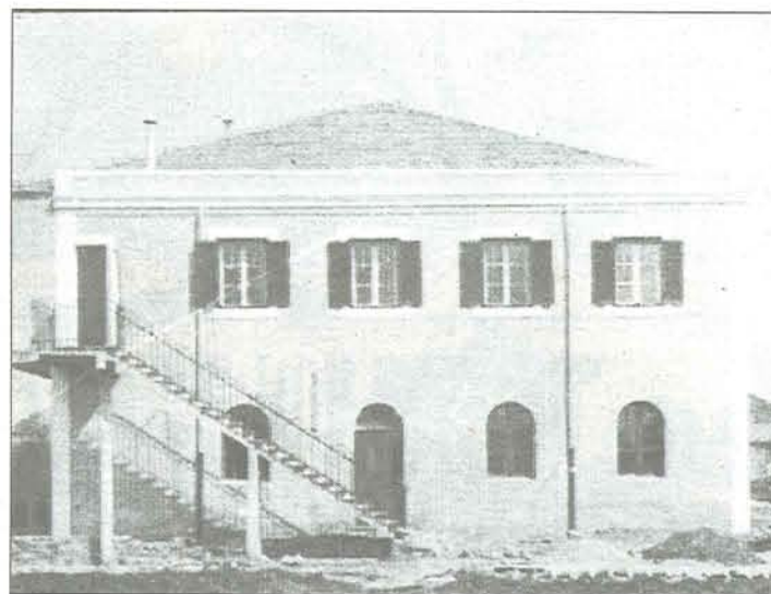
Primer edificio de la Iglesia Evangélica, en la calle de Prendes Pando.

Los transportes que reciba Gijón de Nantes-Saint Nazaire permitirán a El Musel diversificar su perfil portuario y aumentar los tráfico. El último ejercicio no ha sido bueno por la fuerte caída de las importaciones de carbón térmico.